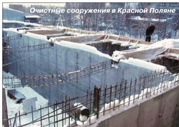
Очистные сооружения в Красной Поляне

◆ Продолжалось проектирование новой котельной на 30 Гкал УМП «Лобненская Теплосеть».