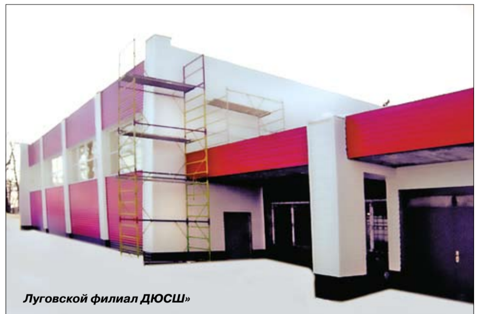
Луговской филиал ДЮСШ

♦ Количество занимающихся физической куль-