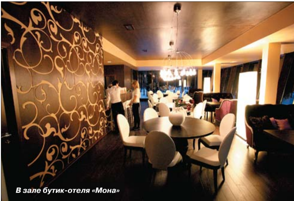
В зале бутик-отеля «Мона»

Городская структура потребительского рынка и услуг населению состоит из более 300 предприятий торговли (в том числе около 40 сетевых магазинов), свыше 100 предприятий бытового обслуживания и около 30 предприятий общественного питания.