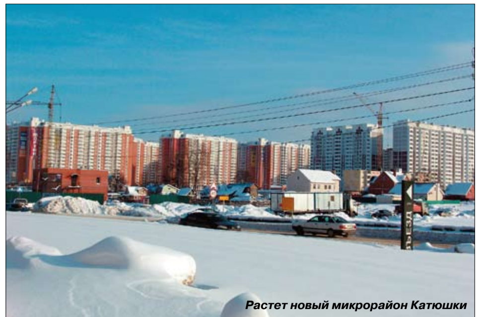
Растет новый микрорайон Катюшки

◆ ЗАО «Регионинвестстрой» осуществлял строительство дома № 3 корп. 1 по ул.Спортивная в микрорайоне Красная Поляна.