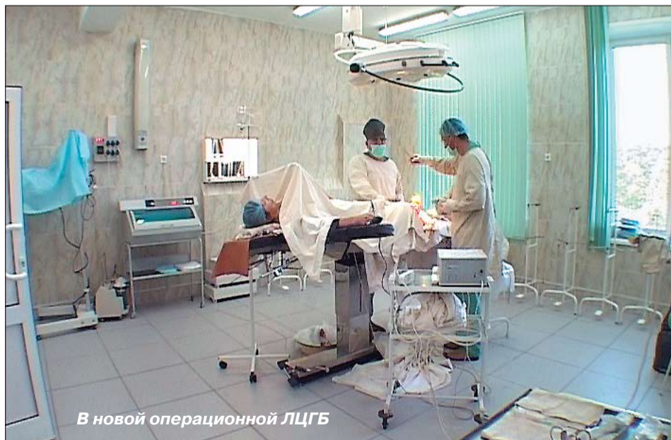
В новой операционной ЛЦГБ

♦ лого-анатомического отделения, на что затрачено 11 млн. рублей из местного бюджета; ♦ -приобретено современное оборудование на сумму свыше 6 млн. рублей; ♦ -открыта и работает бактериологическая лаборатория на базе Краснополянского поликлинического отделения. ♦ Продолжалось проектирование