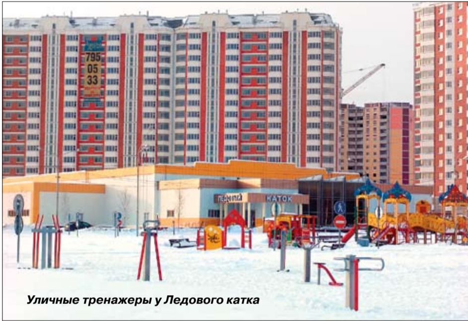
Уличные тренажеры у Ледового катка

♦ Значительные работы проведены по саночистке города: