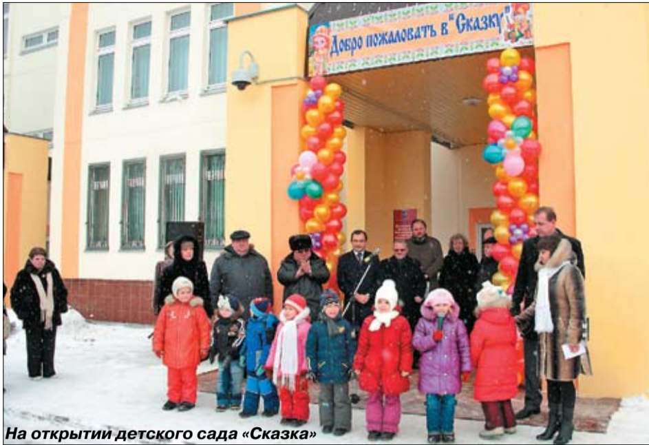
На открытии детского сада «Сказка»

◆ На территории ЛЦГБ построено патолого-