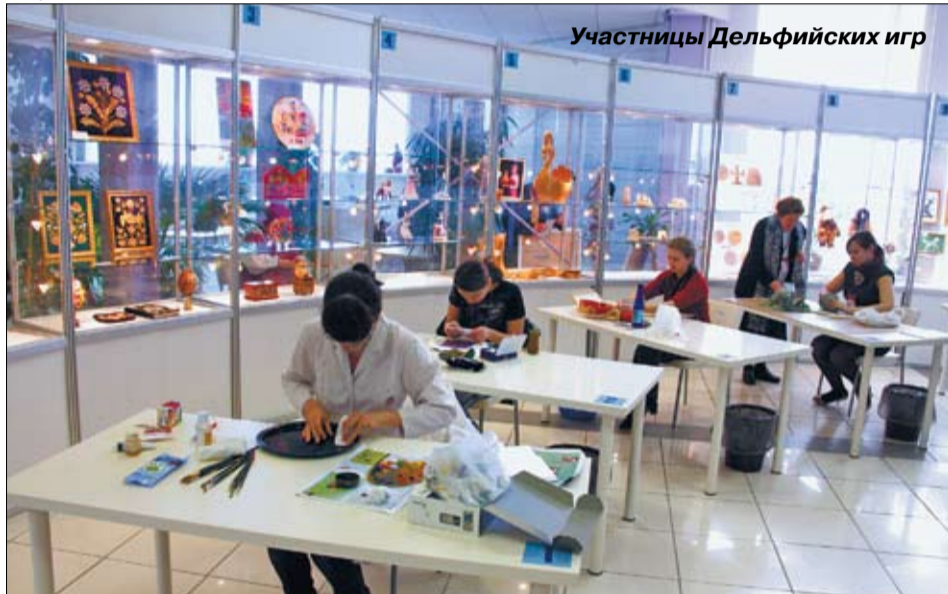
Участницы Дельфийских игр

♦ Отдел по делам молодежи с подростками 14-18 лет участвовали в межрегиональном молодежном летнем трудовом лагере социальной адаптации «Новое поколение».