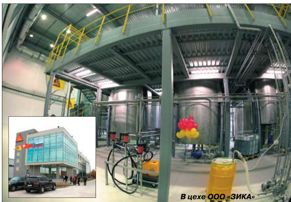
В цехе ООО «ЗИКА»

◆ В связи с вводом в эксплуатацию новых торговых площадей, нача-