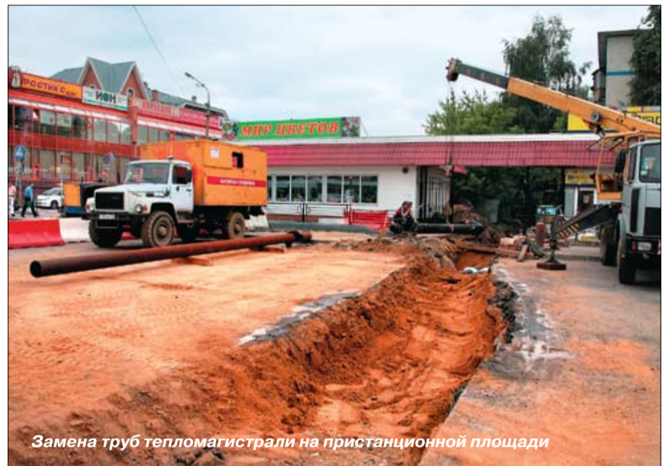
Замена труб тепломагистрали на пристанционной площади