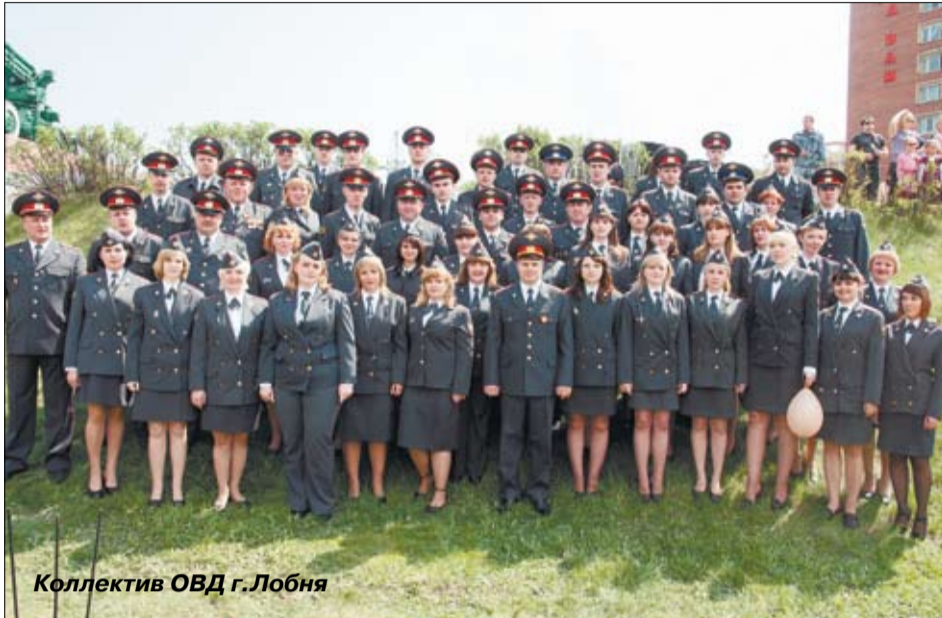
Коллектив ОВД г. Лобня

◆ Решены вопросы по выделению служебных помещений мировым судьям, службе судебных приставов, ФСБ, лицензионно – разрешительной системе Лобненского ОВД.