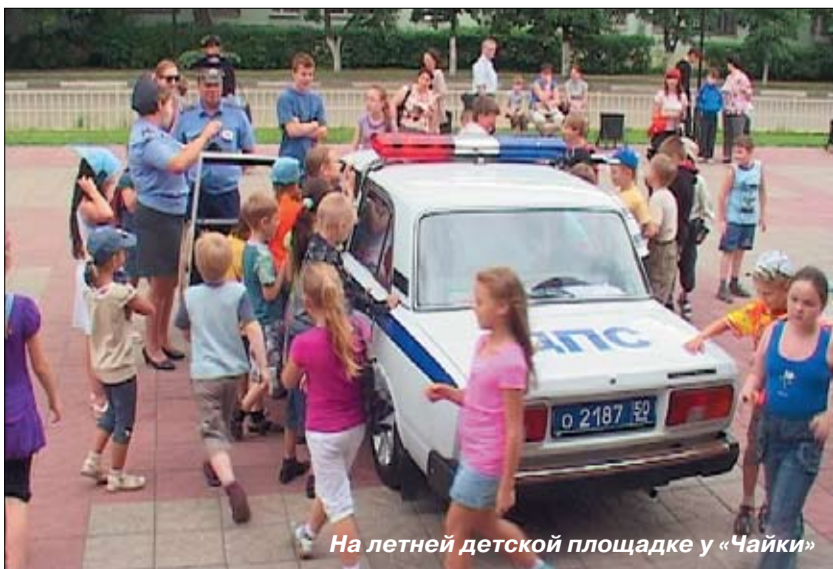
На летней детской площадке у «Чайки»

◆ Новогородную городскую елку посетили бесплатно 568 детей (инвалиды, находящиеся под опекой, из малообеспеченных, многодетных семей, Дома ребенка, социально-реабилитационного центра).