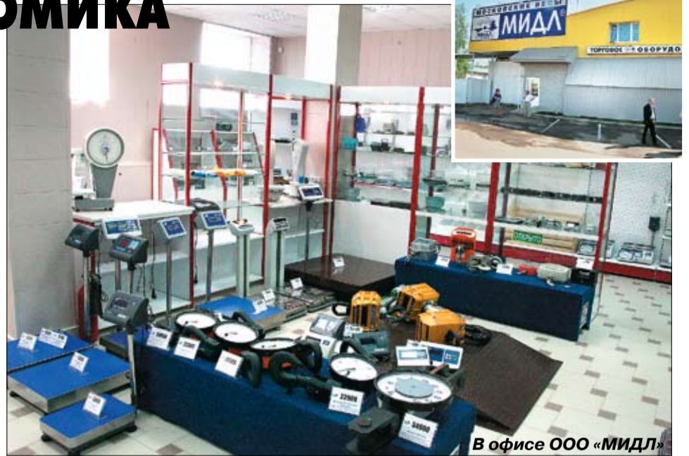
В офисе ООО «МИДЛ»

◆ По итогам работы за 2010 год Лобненская торгово-промышленная палата прочно удерживает позицию среди лучших торгово-промышленных палат Московской области.