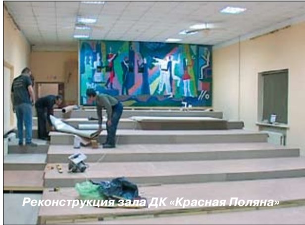
Реконструкция зала ДК «Красная Поляна»

♦ Для пополнения библиотечного фонда приобретено литературы на сумму более 260 тыс. рублей и оформлена подписка на периодическую печать на 200 тыс. рублей.